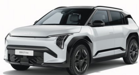
Snow White Pearl [SWP] metallic (pearleffekt)