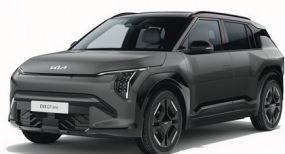
Shale Gray [EBD] metallic