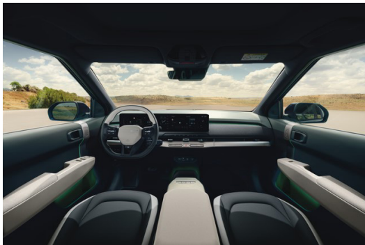
EV3 GT LINE Long Range Konstläder Mörkgrå/Vit