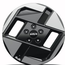
EV3 17" aluminiumfälgar 215/60 R17