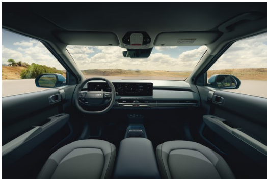
EV3 Standard Range/Long Range Tygklädsel Mörkgrå/grå