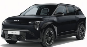
Aurora Black Pearl [ABP] metallic (pearleffekt)