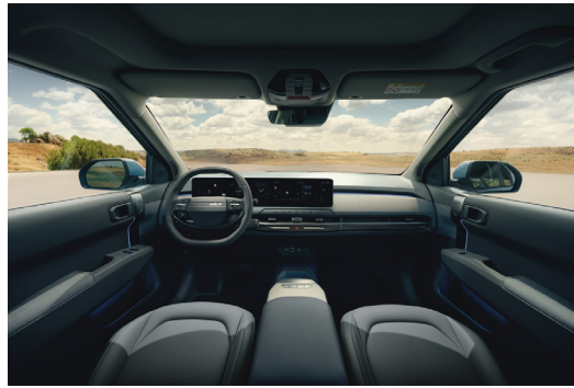
EV3 Plus Long Range Konstläder Mörkgrå/grå